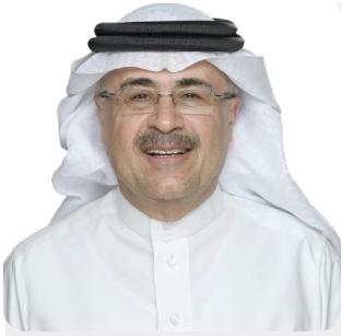
أمين بن حسن الناصر الرئيس وكبير الإداريين التنفيذيين

”بفضل الله واصلت أرامكو السعودية تحقيق أداء مالي قوي مع أرباح وتدفقات نقدية قوية خلال النصف الأول من العام، ما انعكس بدوره على تقديم توزيعات أرباح أساسية مستدامة ومتزايدة، بالإضافة إلى توزيعات أرباح مرتبطة بالأداء، والتي تتنامى مع زيادة عدد مساهميننا.